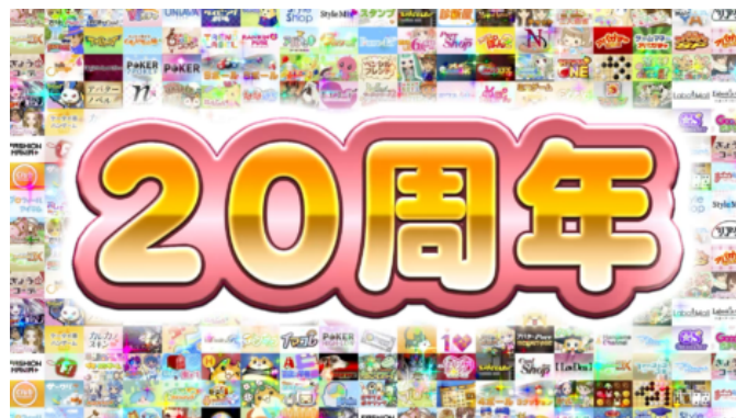
cocone fukuoka 株式会社 ハンゲ ハンゲ20周年記念動画広告 https://youtu.be/TKjhrU3wNPg