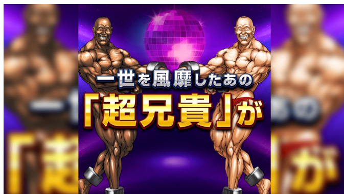
株式会社LIG ダンシング・オブ・超兄貴 帰ってきた訴求編 https://youtu.be/-uGSrZr-1wY