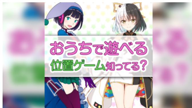
株式会社モバイルファクトリー 駅メモ! おうちで遊べる訴求編 https://youtu.be/q_VBWVYBne4