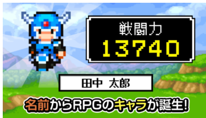
株式会社ピース 名前でたたかうRPG コトダマ勇者 システム訴求編 https://youtu.be/Jq3DV_r9WqM