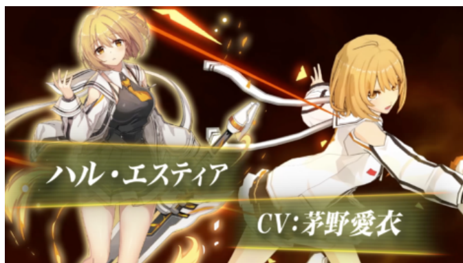
株式会社 Wemade Online Soulworker キャラクター訴求編 https://youtu.be/GJf6BkxJRkM