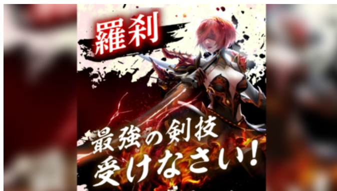
GameBeans Entertainment Co., Limited カオスブレイカー キャラクター訴求編 https://youtu.be/QD15tgkTQ9E